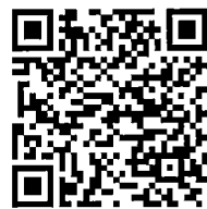
android 系統 (Google Play 商店)