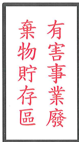
圖 3、貯存區設置白底、紅字、黑框之警告標示圖例