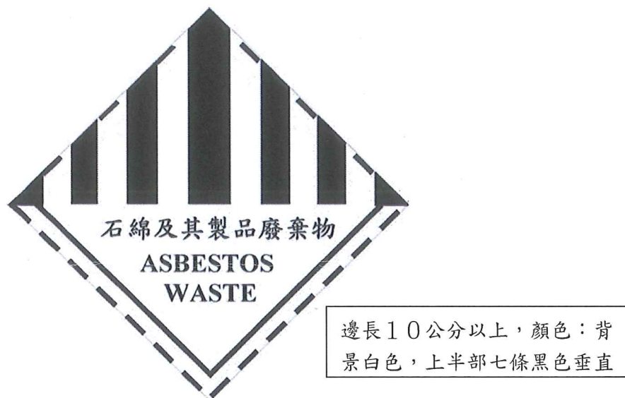
圖 2、有害事業廢棄物特性之標誌-石綿及其製品廢棄物

(三) 太空包外袋應標示事業名稱、廢棄物代碼 C-0701 (石綿及其製品廢棄物)、貯存日期、數量、成分及區別有害事業廢棄物特性標誌 (如圖 2)。